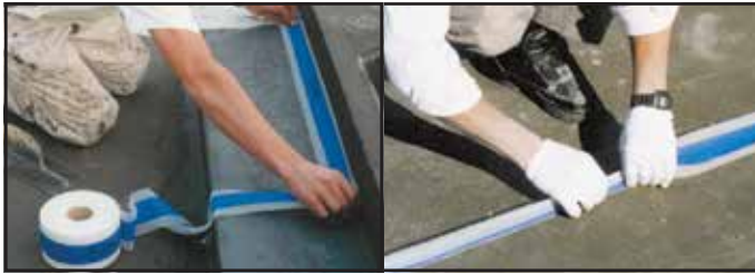
Exemple d'utilisation de Mapeband pour l'imperméabilisation d'un coin situé entre le bas et le côté d'une baignoire

Le tissu Reinforcing Fabric ou le filet Fiberglass Mesh de MAPEI peut être requis (ou facultatif) lors de l'imperméabilisation de l'aire principale. Par conséquent, afin de terminer l'imperméabilisation de l'aire restante (sols ou murs), se référer aux directives sur l'emballage ou la fiche technique du produit d'imperméabilisation MAPEI spécifique à installer.